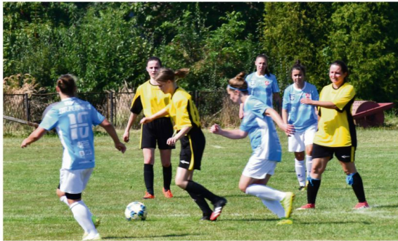
Z przedostatniego miejsca w rozgrywkach trzeciej ligi do rundy wiosennej przystąpi zespół KKPn Iskry Brzezinka.

Po pierwszej rundzie w trzeciej lidze kobiecej (grupa IV) prowadzi Górnik II Łęczna (24 pkt), który ma punkt więcej od rezerwy Resovii i dwa „oczka” przewagi nad duetem – Naprzód Sobolów,