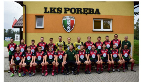
Porębianie przystąpią do rundy rewanżowej z jedenastego miejsca w tabeli oświęcimskiej klasy A.

26 lutego), KS Bestwinki (4-5 marca), Wikliniarz Woźniki (11-12 marca) i Pioniera Pisarowice (18-19 marca).