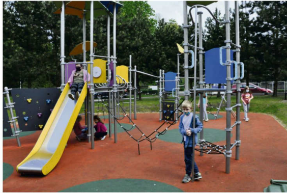
Szkolny plac zabaw w Grojuc odżył w maju.

Podczas zdalnych zajęć już samo sprawdzenie obecności pochłania czas i energię. Nauczyciel zgodnie z zaleceniami pyta uczniów o samopoczucie, bo jeśli stanie się coś niepokojącego, to mimo internetowej kamery po prostu tego nie widać. W młodszych klasach