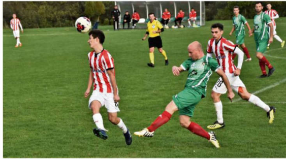
Pierwszą rundę czwartoligowych rozgrywek piłkarze z Rajksa zakończyli na siedemnastym miejscu w tabeli.

Później przyszła porażka w Myślenicach z miejscowym Dalinem 5:3. W tym meczu także wszystko decydowało w samej końcówce. Jeszcze na 10 minut przed końcem na tablicy świetlnej widniał rezultat remisowy 2:2, ale trzy punkty zostały ostatecznie w Myślenicach. Gole