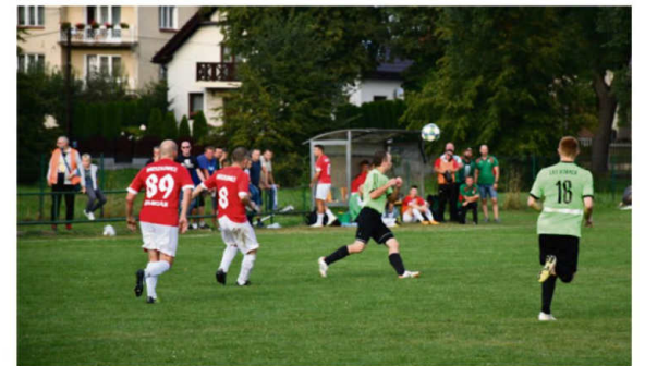
Beniaminek z Broszkowic nie będzie miał w tym sezonie problemów z utrzymaniem w klasie A.

bolówkę sprytnie wycofał Michał Barciak. Ostatecznie Solavia zremisowała z Pulsem 3:1.