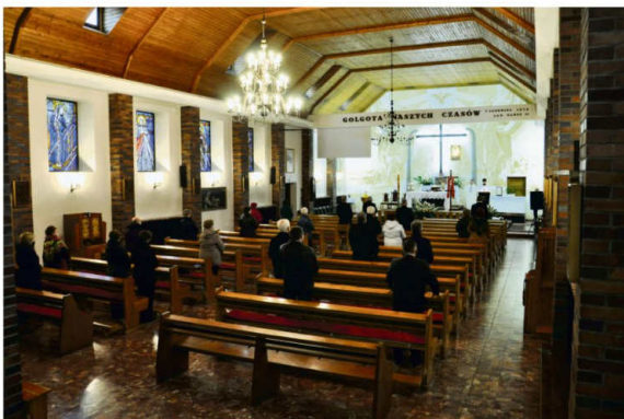
Msza w intencji Wysiedlonych w kościele Matki Bożej Królowej Polski w Brzezince.

Najbardziej ucierpiała Brzezinka. Domy posłużyły za budulce obozowych baraków. Z przeszło pięciuset budynków mieszkalnych po wojnie,